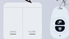
(設置型) (キーホルダー型)