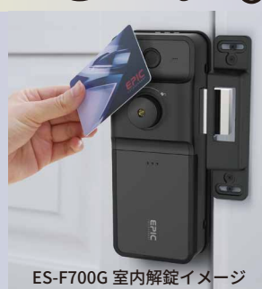
ES-F700G 室内解錠イメージ

昨今、深刻な問題となっている認知症。そして当社は以前から「電子錠を徘徊対策に使えないか」というお声を多く頂いており、当社でもこの問題に目を向けることで、社会貢献ができるのではないかと考えました。そして研究開発の上、室内機にも認証装置を設けることで徘徊対策としての役割を実現することに成功しました。この技術は特許を取得しております。