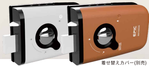
着せ替えカバー(別売)