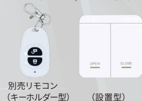
別売リモコン (キーホルダー型) (設置型)